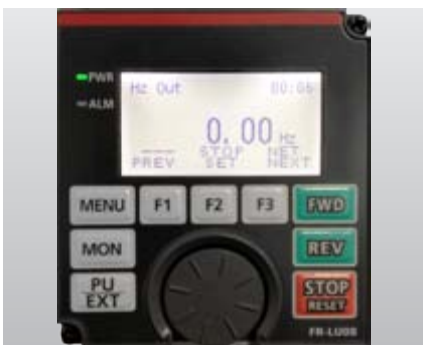
FR-LU08 mit Volltextanzeige in bis zu fünfzehn Sprachen und mit Echtzeithr.

Mit dem integrierten „Digital Dial“ der Bedieneinheit hat der Anwender einen direkten Zugriff auf alle wichtigen Parameter. Entscheiden Sie sich für die Bedieneinheit, die Ihren Anforderungen gerecht